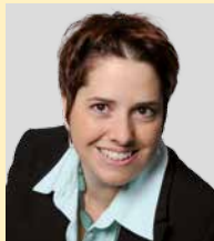
Isabelle Chevalley Conseillère nationale Vert'libéraux - VD