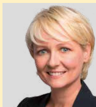
Isabelle Moret Conseillère nationale PLR - VD