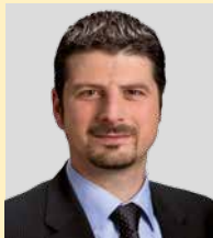
Yannick Buttet Conseiller national PDC - VS