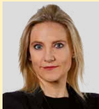
Céline Amaudruz Conseillère nationale UDC - GE